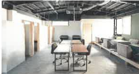
施設内観(コワーキングスペース)