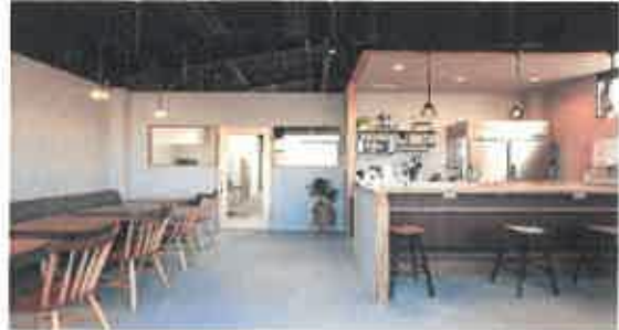
施設内観(シェアキッチン&カフェスペース)